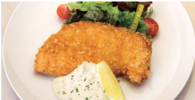
サーモンフライランチ ・スープ・ご飯付 1,300円 (税込)