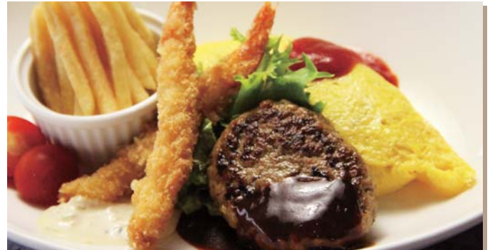
お子様プレート・スープ付 1,100円 (税込)