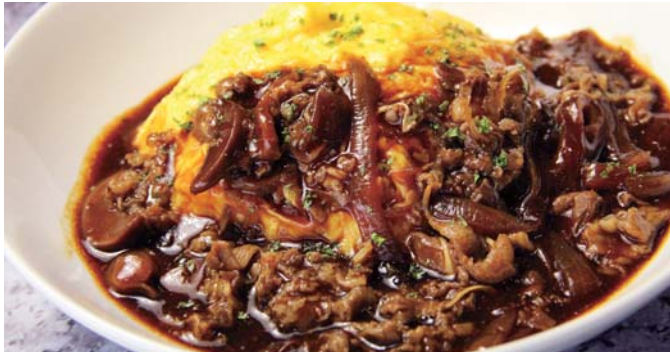
オムハヤシ 1,200円 (税込)